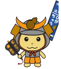
『ひょうたん山夢街道まつり』実行委員会制作

『ひょうたん山夢街道まつり』事業への広告提供・寄付、その他参加などご協力者を募集しております。 当事務局 東大阪市 市民協働室（地域サポートダイヤル）070-6425-3133