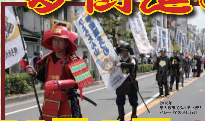
2016年 東大阪市民ふれあい祭り パレードでの時代行列